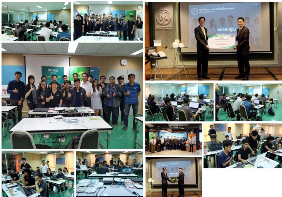
ภาพบรรยากาศวันงาน ณ มหาวิทยาลัยเทคโนโลยีมหานคร